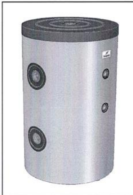
PT HC ...

A nyilatkozat tárgya / object of the declaration / Gegenstand der Erklärung / Objet de la déclaration / Предмет декларации / Předmět prohlášení / Obiectul declarației: